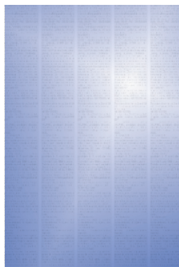
Cijela strana 1/1