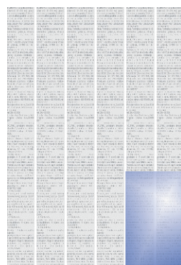
Osmina stranice 1/8