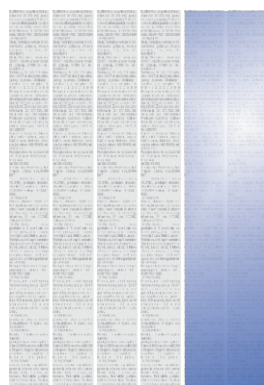
Trećina stranice 1/3