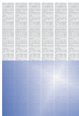
Polovica stranice 1/2