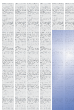
Četvrtina stranice 1/4