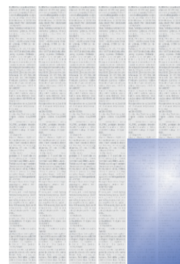
Šestina stranice 1/6