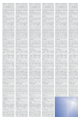
Šesnaestina stranice 1/16